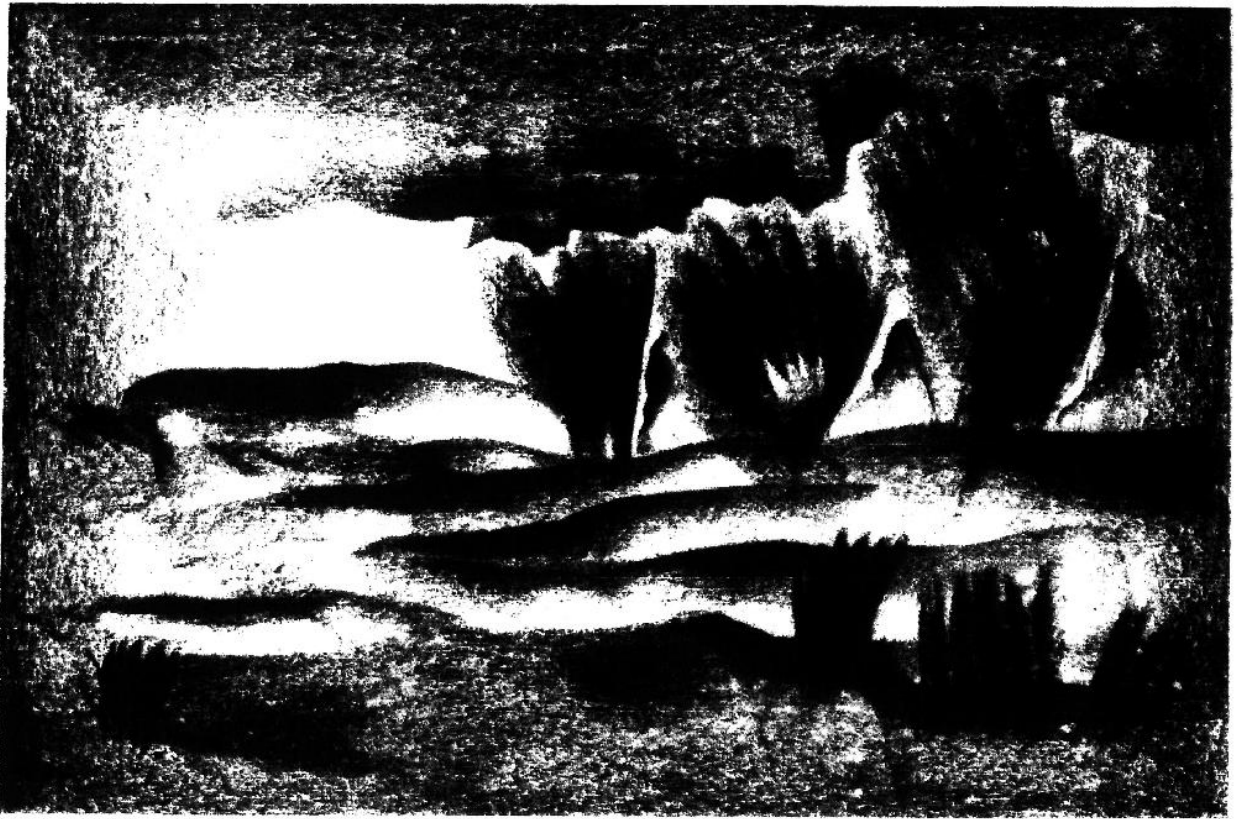
Paesaggio di dune, alberi e nuvole.

La prima sorella che incontrò fu la nera fame tra l'acqua e la neve. Senza lavoro e con una grande Fede da difendere: il Mito che intravvide giovanissimo e che lo accompagnerà per sempre.