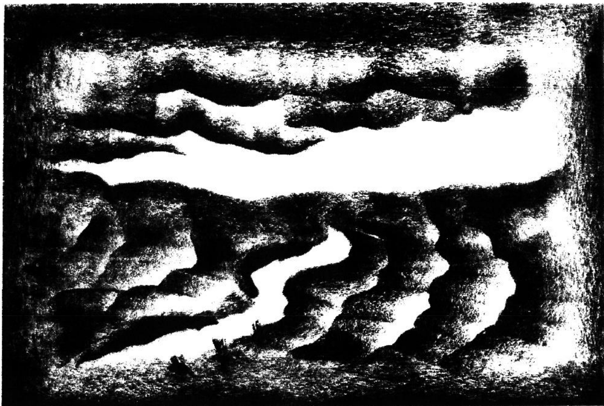
Minaccia di nubi sulla valle.

d'esperimentarsi e di controllarsi. Lesse pochissimo, osservò moltissimo il libro della vita, scrisse poco, poi scrisse moltissimo, ma nessuno comprese il suo linguaggio ermetico come la sua intima arte.